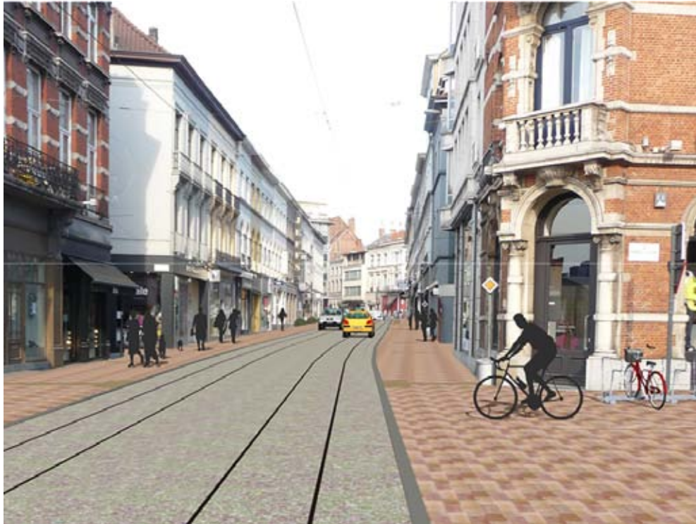
Zo wordt het BRAVOKO project misleidend voorgesteld:

Geen tramstellen. Slechts enkele auto's in de verte. Geen fietsers in de Brabantdam die op het voetpad gejaagd worden door aankomend stedelijk spoorverkeer. Afwezigheid van zwaar verkeer. Het lijkt wel een echte winkelstraat conform de Europese succesvolle voorbeeldsteden.