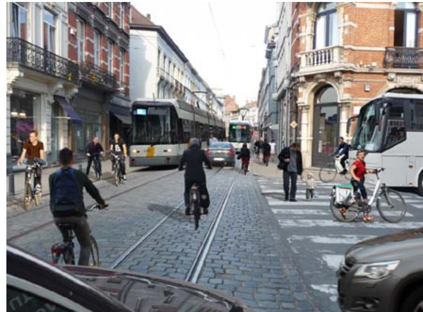
Foto die wél de feitelijke problematische situatie weergeeft met kruisend tramverkeer en fietsers die het voetpad opgejaagd worden, waar wél zwaar verkeer en auto's in twee richtingen welkom zijn. Deze infrastructurele aanpak van een centrumstraat met een hoge concentratie aan winkels wordt daardoor in het aangereikte 'toekomstbeeld' van 'Gent vernieuwt' schadeverwekkend miskend.

'Toekomstbeeld' op moment dat er geen stedelijk spoorverkeer in deze smalle winkelstraat rijdt, noch fietsers op het voetpad gejaagd worden door aankomende tramstellen, noch enige impressie van het zeer vele autoverkeer.