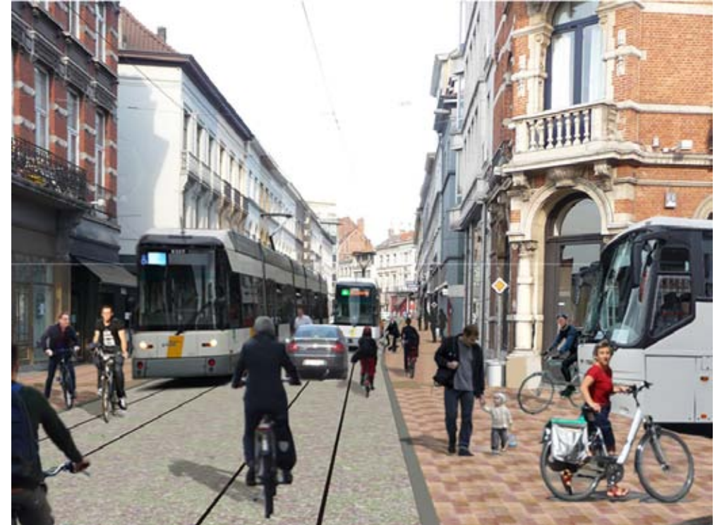
Hierboven een correcte voorstelling van het BRAVOKO project.

Geen tramstellen. Slechts enkele auto's in de verte. Geen fietsers in de Brabantdam die op het voetpad gejaagd worden door aankomend stedelijk spoorverkeer. Afwezigheid van zwaar verkeer. Het lijkt wel een echte winkelstraat conform de Europese succesvolle voorbeeldsteden.