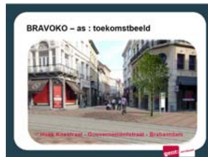
Wat ons ernstig misleidend wordt voorgesteld