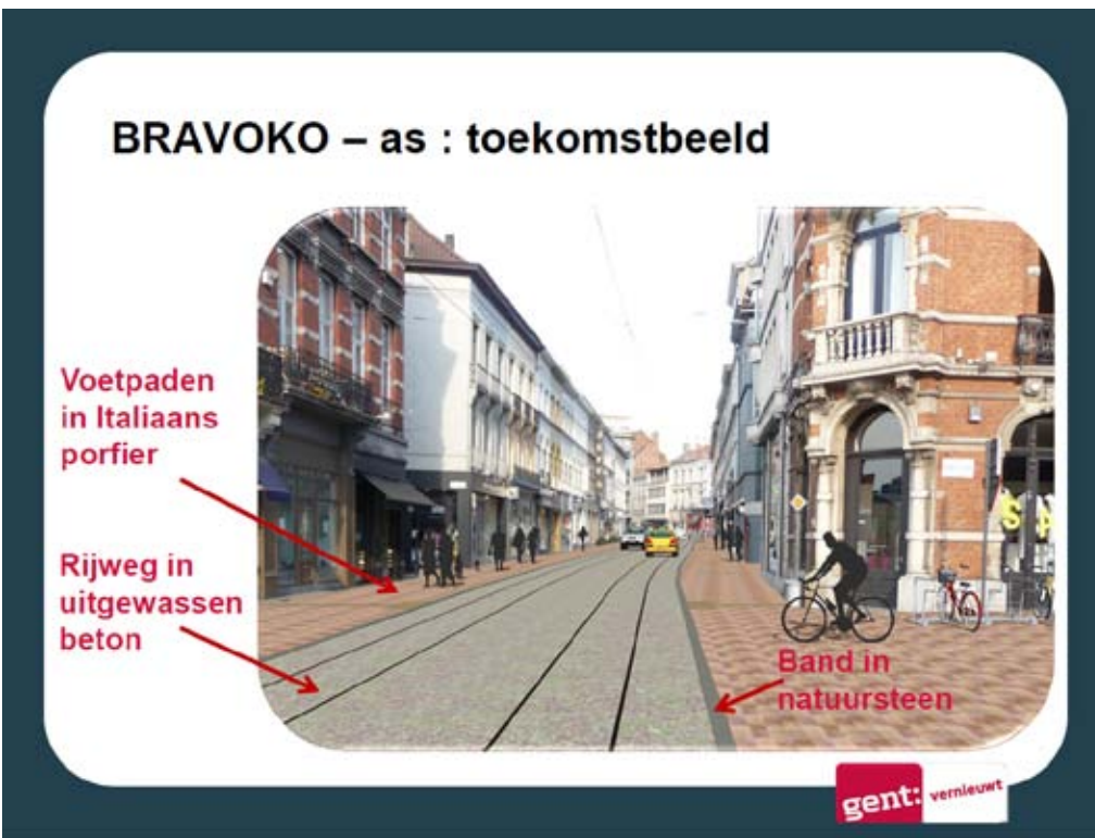
Misleidend, ongeïnspireerd en nefast toekomstbeeld' van een belangrijke winkelstraat in Gent

Het Bravoko project heeft dan ook niets geleerd van de Europese voorbeeldsteden en houdt een situatie aan die volstrekt is achterhaald en geenszins de geactualiseerde verwachtingen ten aanzien van een stadscenrum beantwoordt.