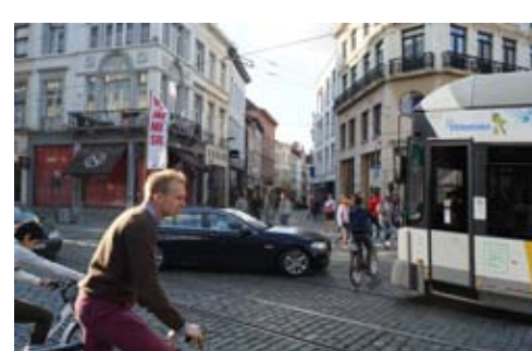
De actuele situatie die wordt aangehouden in het BRAVOKO project

Neen aan het BRAVOKO project omdat het de te smalle straten van het stadscentrum onverminderd geschikt acht voor een dubbele rij stedelijk spoorverkeer.